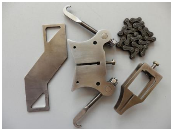
Волноводы – Термобуфферы для высокотемпературных применений