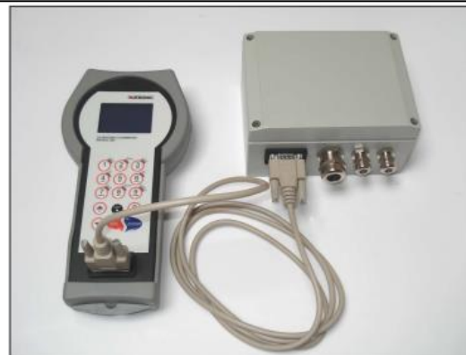
KATflow 100 без дисплея и инструмент установки