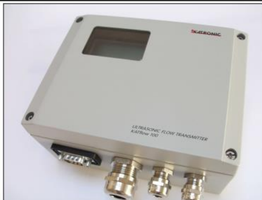
KATflow 100 с дисплеем