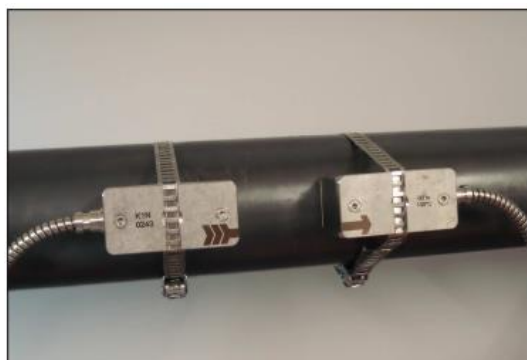
Крепление преобразователей при помощи лент и зажимов